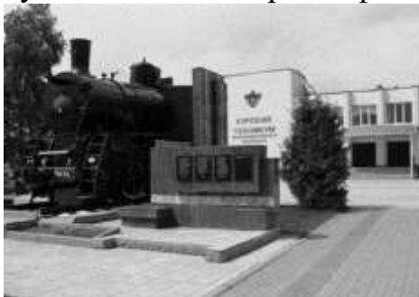
Рис. 2 – Памятник студентам и сотрудникам техникума, погибшим во время Великой Отечественной войны.