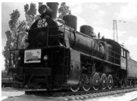
Рис. 1 – Паровоз М-728-73.