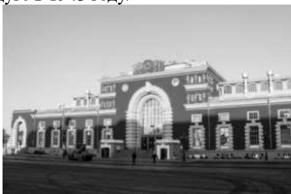
Рис.4 – Здание курского железнодорожного вокзала

Здание вокзала в Курске (Рис.4) по замыслу автора – ленинградского архитектора Явейна Игоря Георгиевича – представляет собой своего рода памятник героям Курской битвы. Величественное, словно дворец, строение радует глаз жителей и гостей города. На фасаде здания вокзала со стороны пассажирских платформ были установлены мемориальные доски в честь ратных подвигов курских железнодорожников и коллектива станции Курск в дни битвы на Огненной дуге в 1943 году.