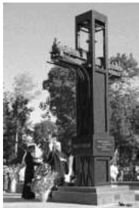
Рис.3 – Монумент в память о боевых и трудовых подвигах работников курской железной дороги