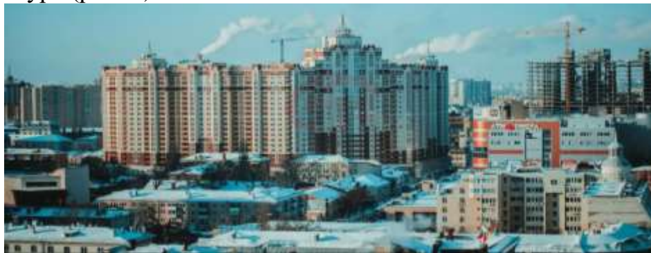
Рис. 2. Улица Куколкина в наши дни

Наша история – это зеркало, в которое смотрится настоящее. Великая Отечественная война оставила глубокий след в истории России, в каждом городе есть улицы, названные в честь героев, защищавших эти города. Мы должны всегда помнить героев войны, благодаря которым мы живем сейчас. Мы, молодое поколение людей, родившихся в XXI веке, помним защитников нашей Родины.